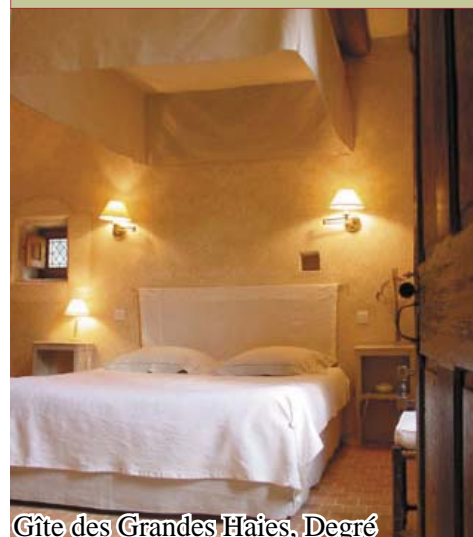
Gîte des Grandes Haies, Degré

Les amoureux du patrimoine et de l'habitat écologique se sentiront bien dans cette maison plusieurs fois centenaires où confort et respect du bâti ancien sont présents : isolation au chanvre, chauffage au sol par forage géothermiques. Plafond peint du début du 17 ème en partie restaurée. Logement au RDC: entrée, cuisine, séjour avec canapé lit gigogne, bibliothèque touristique. Terrain paysagé de 1 ha aux ambiances variées.