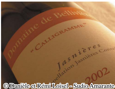
© Danièle et Rémi Loisel - Studio Amarante