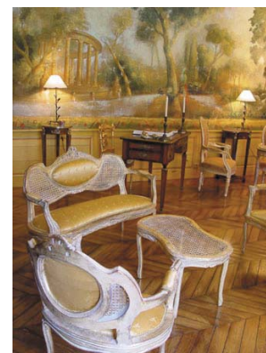
La Villa des Arts