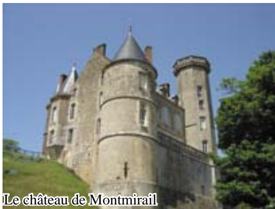
Le château de Montmirail