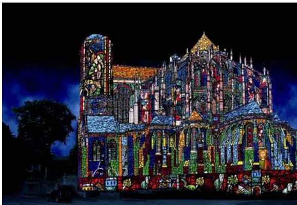
Une création Skertzo pour la Ville du Mans / Gilles Moussé

A partir du 5 décembre 2009, Skertzo s'empare également du chevet de la cathédrale Saint-Julien, avec une création "entre anges et démons".